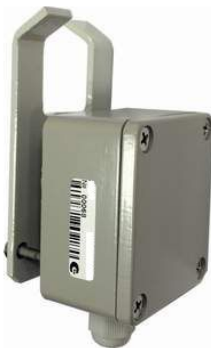
Рис. 1 Внешний вид СКАУ-01-В

СКАУ-01-В входит в состав интегрированной системы безопасности (ИСБ) «ИНДИГИРКА» (НЛВТ.425513.111 ТУ) и подключается к АШ БЦП исп. 7, исп.7-1, БЦП исп.7У, исп.7-1У или сетевых контроллеров адресных устройств СКАУ-01 исп. 1 и СКАУ-01 исп. 2, а также адресных контроллеров КА2 исп.08, исп.08-1.