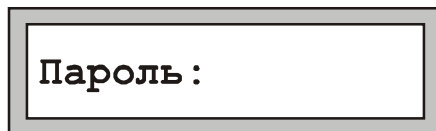
Рис. 2 Авторизация пользователя

Для перевода ПУО в режим ввода команд пользователя необходимо произвести авторизацию, т.е. регистрацию в БЦП. Для вывода на дисплей окна авторизации (Рис. 2) нажать любую клавишу. Далее ввести пинкод зарегистрированного в БЦП пользователя и нажать «#».