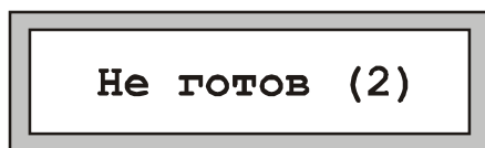
Рис. 4 Сообщение о неготовности зоны

В случае неготовности зоны к постановке на охрану в скобках будет указано число неготовых ШС (Рис. 4).