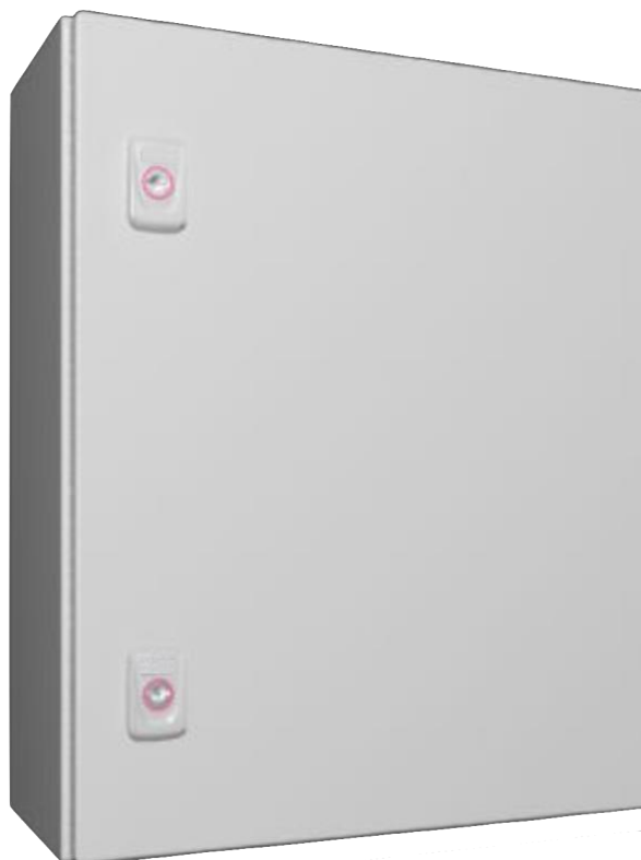
Рис. 1 Внешний вид концентратора

Кабельный ввод организуется с верхней стороны концентратора.