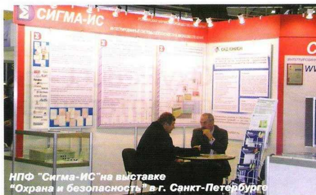
НПФ "Сигма-ИС" на выставке "Охрана и безопасность" в г. Санкт-Петербурге

щее время специалистами НПФ "Сигма-ИС" ведутся работы по созданию аппаратного шлюза между ИСБ "Рубеж" и внешними LON-устройствами. Данное решение позволит интегрировать на аппаратном уровне систему безопасности с инженерным оборудованием, поддерживающим LonWorks.