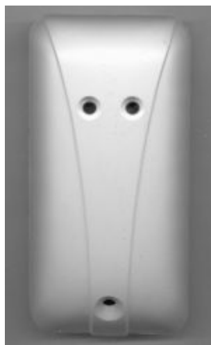
Рис. 1 Внешний вид устройства

СКАУ-01-С входит в состав интегрированной системы безопасности (ИСБ) «ИНДИ-ГИРКА» (НЛВТ.425513.111 ТУ) и подключается к АШ БЦП исп. 7, исп.7-1, БЦП исп.7У, исп.7-1У или сетевых контроллеров адресных устройств СКАУ-01 исп. 1 и СКАУ-01 исп. 2, а также адресных контроллеров КА2 исп.08, исп.08-1.