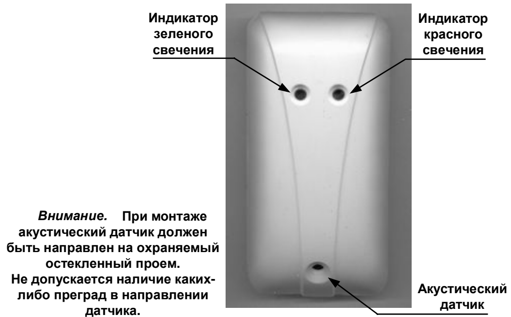
Рис. 2 Индикация, монтаж