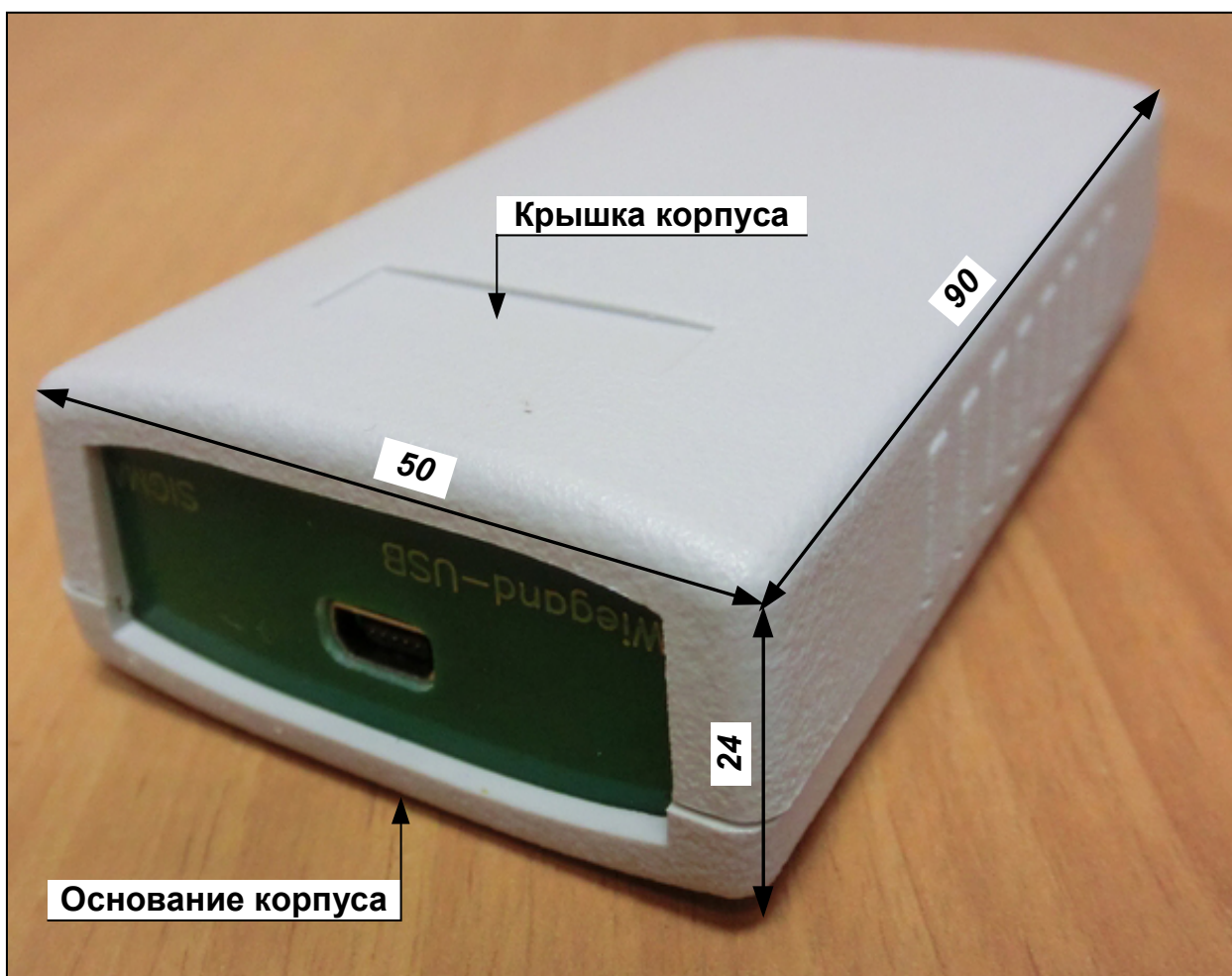
Рис. 1 Внешний вид, габариты ПИ.

Внешний вид и габариты ПИ приведены на Рис. 1.