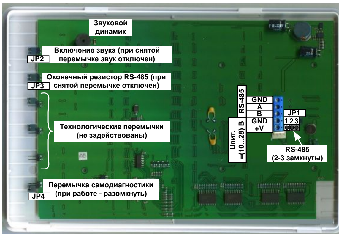
Рис. 3 Внешний вид платы БИУ. Подключение.