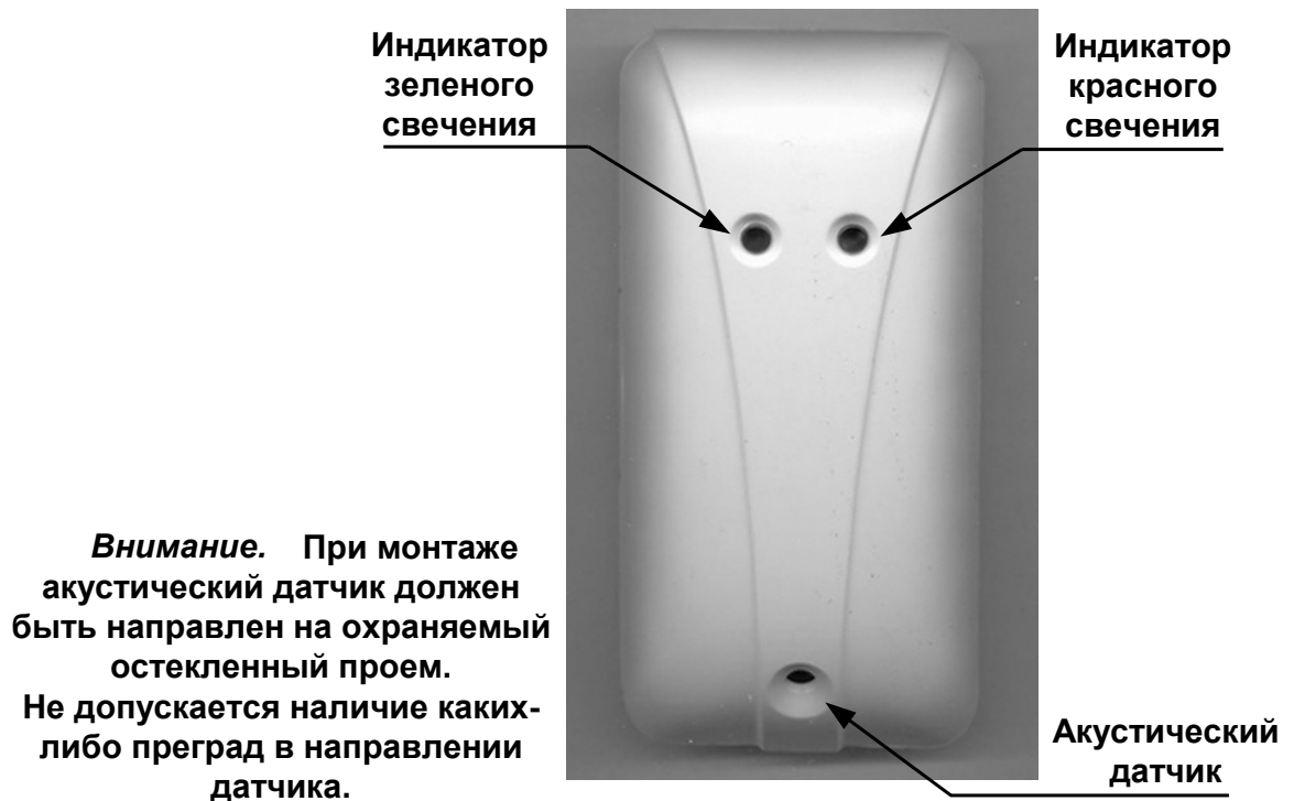
Рис. 1 Внешний вид ИРС

ИРС подключаются в АШ (адресный шлейф) и используется совместно с БЦП исп.7 или СКАУ-03.