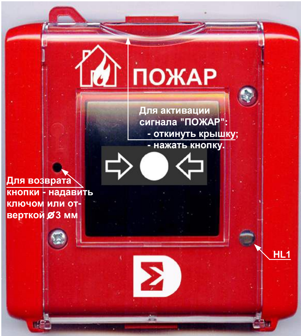
Рис. 1 Внешний вид ИР-П, ИР-П исп.2.

Внимание ! Запрещается закрывать крышку при нажатой кнопке. Перед сборкой устройства (после монтажа) кнопка должна быть отжата, а также проверить состояние рычага микропереключателя (см. Рис. 2).