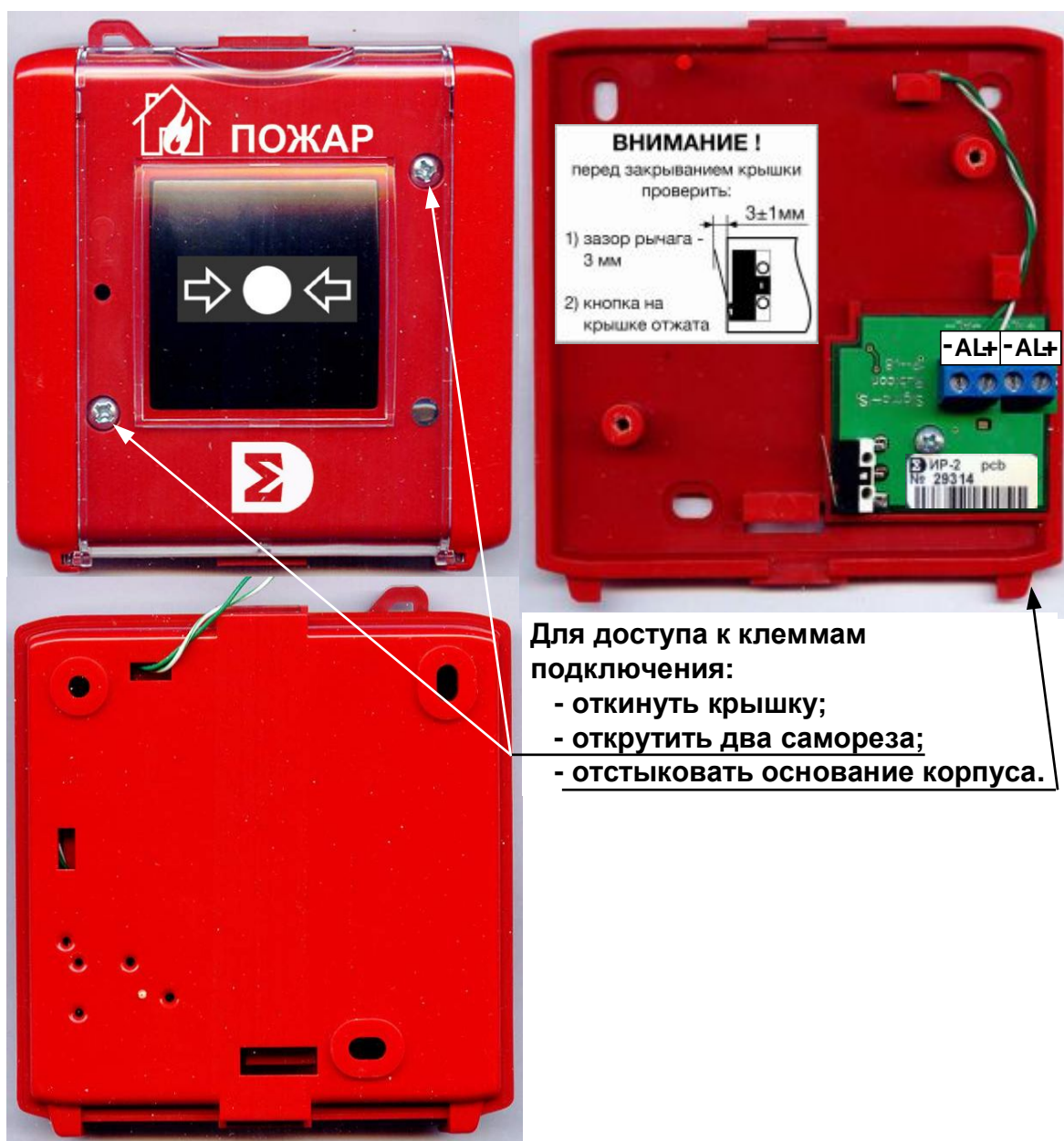
Рис. 2 ИР-П, ИР-П исп.2. Внешний вид, клеммы подключения.

Основные размеры, включая присоединительные, приведены на Рис. 3.