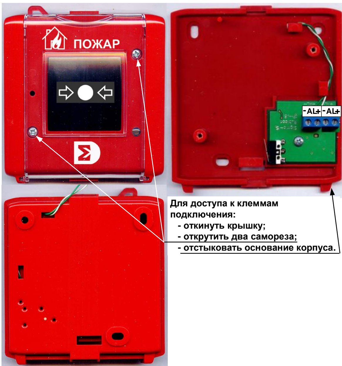
Рис. 2 ИР-П, ИР-П исп.2. Внешний вид, клеммы подключения.

Основные размеры, включая присоединительные, приведены на Рис. 3.