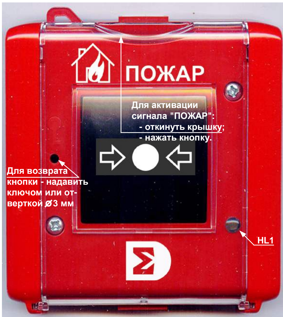
Рис. 1 Внешний вид ИР-П, ИР-П исп.2.