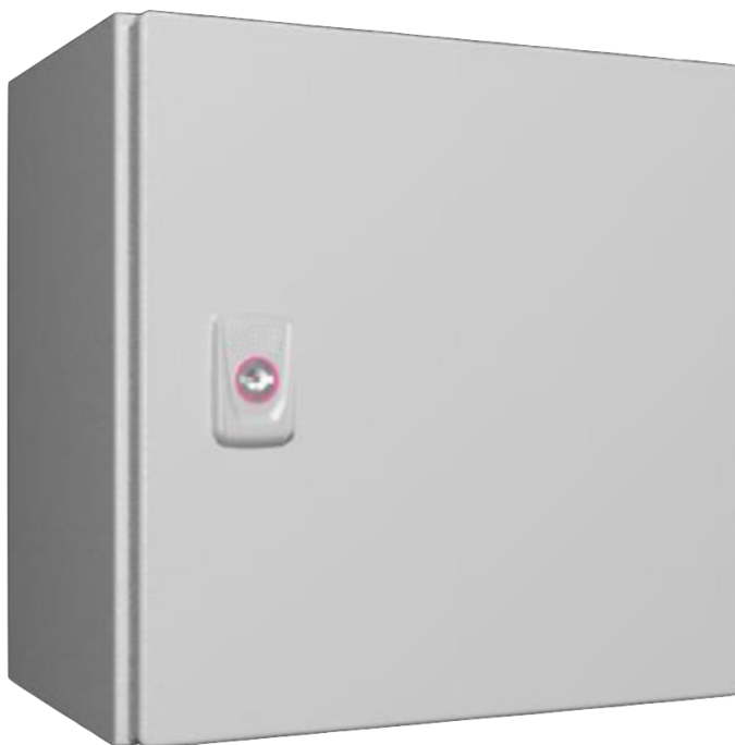
Рис. 1 Внешний вид концентратора

Кабельный ввод организуется с верхней стороны концентратора.