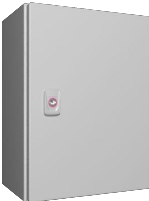
Рис. 1 Внешний вид концентратора

Кабельный ввод организуется с верхней стороны концентратора.