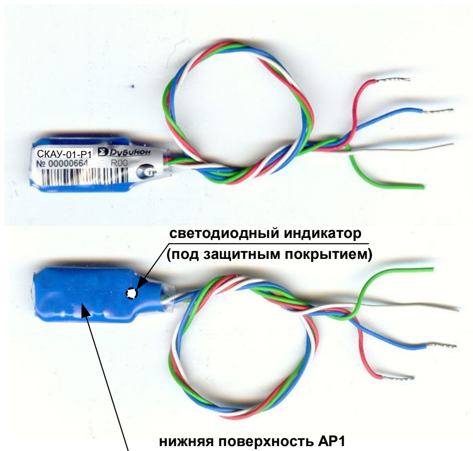
Рис. 1 Внешний вид СКАУ-01-Р1

СКАУ-01-Р1 входит в состав интегрированной системы безопасности (ИСБ) «ИНДИГИРКА» (НЛВТ.425513.111 ТУ) и подключается к АШ БЦП исп. 7, исп.7-1, БЦП исп.7У, исп.7-1У или сетевых контроллеров адресных устройств СКАУ-01 исп. 1 и СКАУ-01 исп. 2, а также адресных контроллеров КА2 исп.08, исп.08-1.