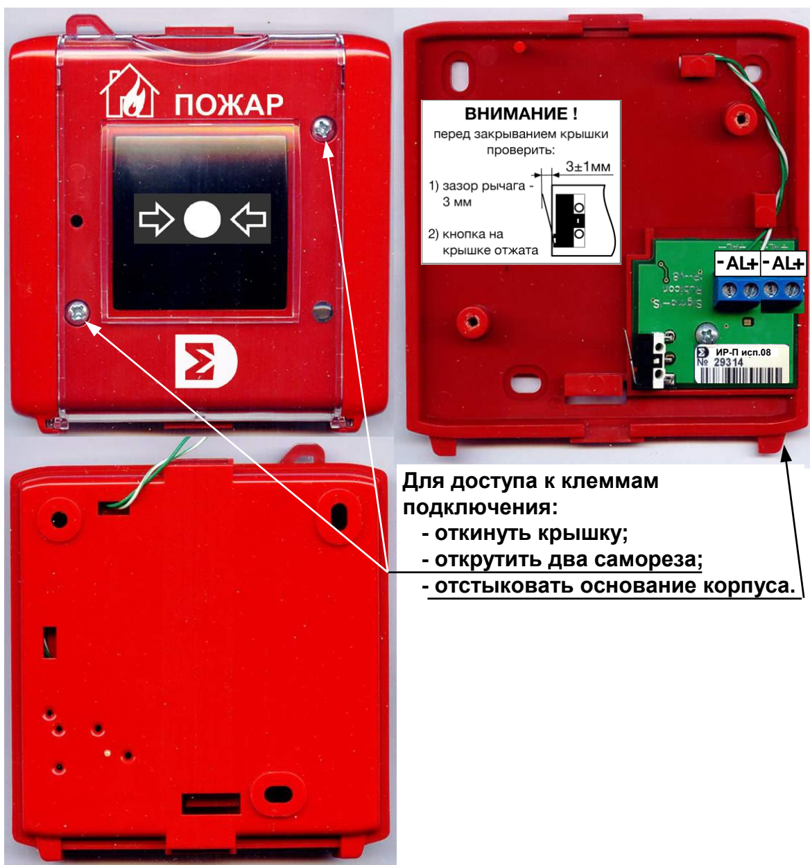
Рис. 2 ИР-П. Внешний вид, клеммы подключения.

Основные размеры, включая присоединительные, приведены на Рис. 3.