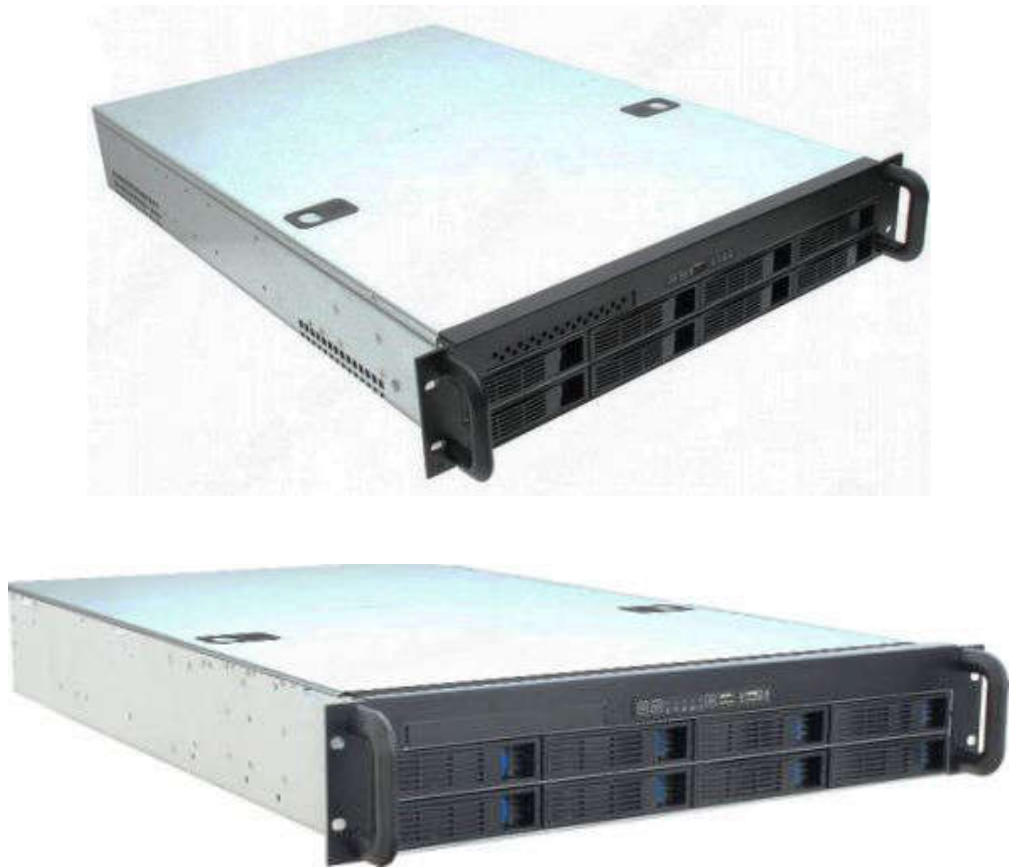
Рис. 1 Внешний вид видеосервера ИД-СВП-08.