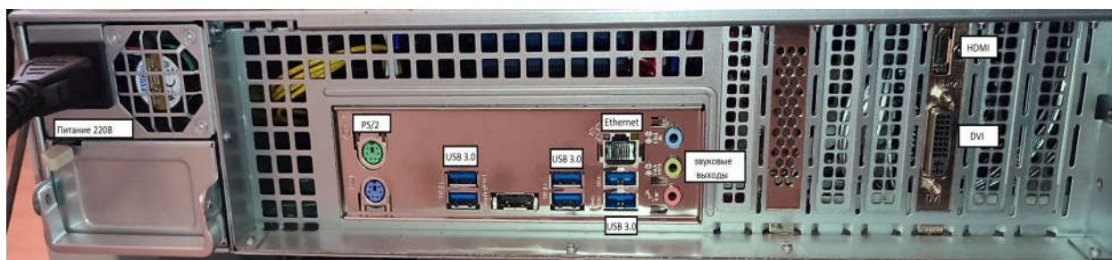
Рис. 2 ИД-СВП-8. Конструкция, органы управления, индикаторы, разъемы подключения сервера.