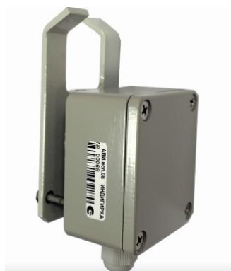
Рис. 1 АВИ исп. 08

Извещатель АВИ рассчитан на применение на сварных конструкциях из металлического прутка диаметром 8...25 мм. Допускается применение на иных металлических конструкциях, но не гарантируется заявленная площадь контроля вибрационного канала.